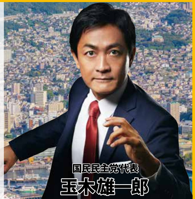
国民民主党代表 玉木雄一郎