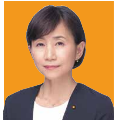
国民民主党長崎県連代表 長崎県第1区総支部長 衆議院議員

今後ともご指導賜ります様お願い申し上げます。コロナ禍、くれぐれも皆様にはお身体を大切にお過ごし下さい。